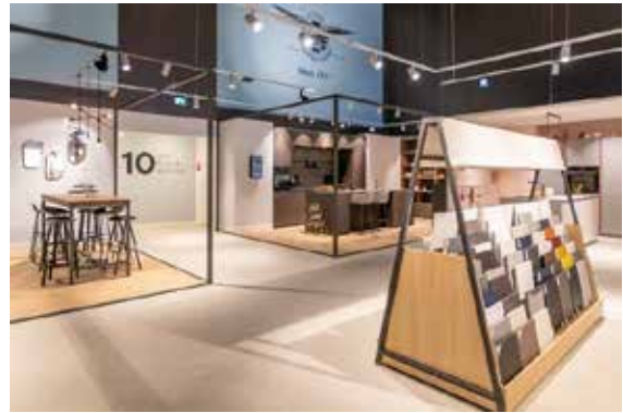
Sfeerimpressies showroom Bruynzeel.